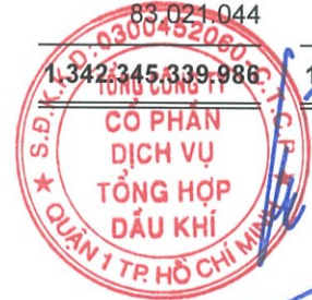
Phùng Tuấn Hà Chủ tịch HĐQT Ngày 29 tháng 3 năm 2018

Các thuyết minh từ trang 10 đến trang 54 là một phần cấu thành báo cáo tài chính hợp nhất này.