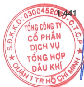
Phùng Tuấn Hà Chủ tịch HĐQT Ngày 29 tháng 3 năm 2018

Các thuyết minh từ trang 10 đến trang 54 là một phần cấu thành báo cáo tài chính hợp nhất này.