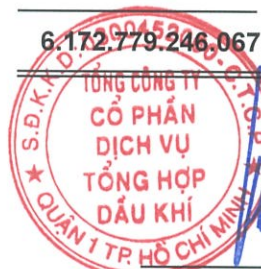
Phùng Tuấn Hà Chủ tịch HĐQT Ngày 29 tháng 3 năm 2018

Các thuyết minh từ trang 10 đến trang 54 là một phần cấu thành báo cáo tài chính hợp nhất này.